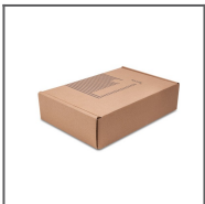
Zestaw prezentacyjny 1 Ref: 90051