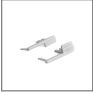
Zaślepka KRAV-56 szara Ref: 24033