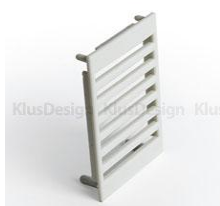
zaślepka BOX (00314)