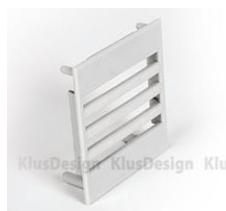
zaślepka NIBO (24001)