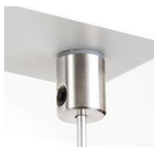
zawieszka wzdłużna do BOX / NIBO, zasilająca (00643)