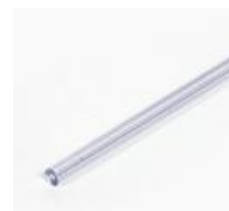
pręt zabezpieczający (00806)