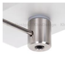
zawieszka poprzeczna do BOX / NIBO, zasilająca (42554)